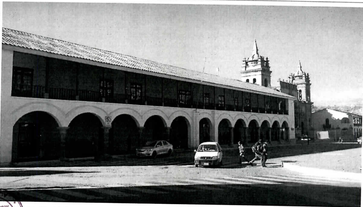
Palacio Municipal de Huamanga

"Año de la consolidación del Mar de Miguel Grau"