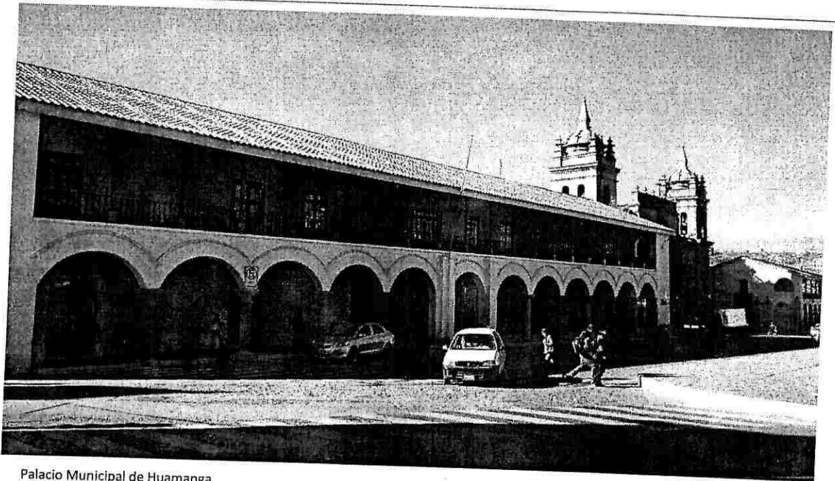
Palacio Municipal de Huamanga