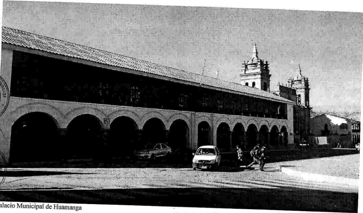
Palacio Municipal de Huamanga