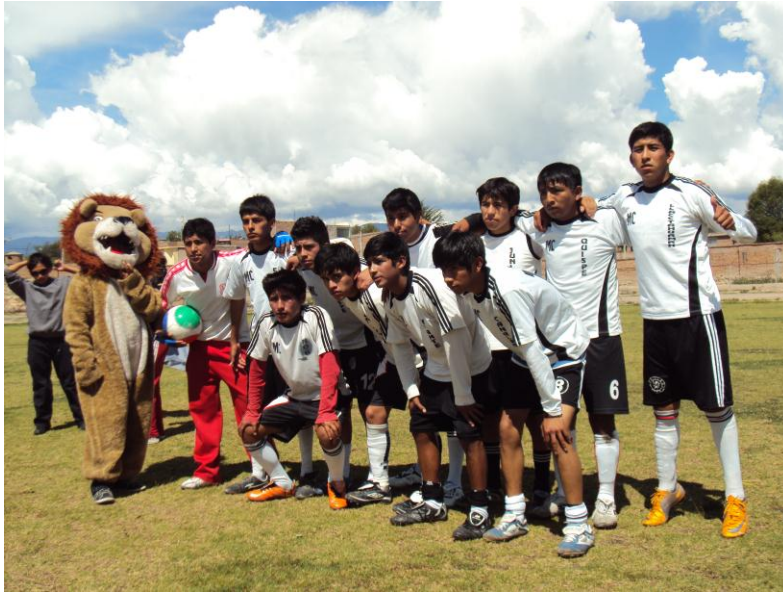
Cuadro N° 09