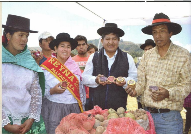
EL SABOR DEL FUTURO: Al centro, Dr. Amílcar Huanchuari Tueros, Alcalde Provincial de Huamanga, rodeado por pequeños productores de papas nativas en la comunidad campesina de Alpachaca, Chiara, a quienes apoya su comuna.

En torno a cinco ejes, empezando por la articulación intergubernamental para aplicar políticas y acciones armonizadas, la organización, capacitación y capitalización de los agentes económicos, la formación de cadenas productivas y el apoyo a las MYPES